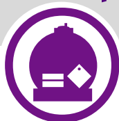
transport de matières dangereuses