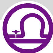
canalisations de matières dangereuses

Une dizaine d'habitations dans le bas du bourg ont été inondées par le Cens suite à des pluies exceptionnelles en 1995, 1999 et 2001. Des travaux seront achevés en 2007 pour protéger les secteurs concernés.